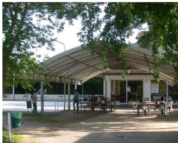
Centro sportivo di Pinarolo Po mappato come superficie strategica