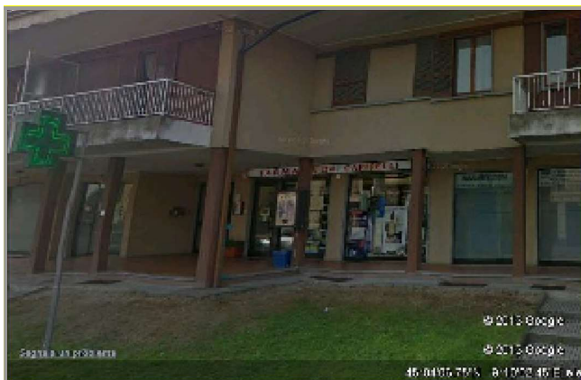
La Farmacia di Castelletto Pinarolo Po in Via Natale Riccardi