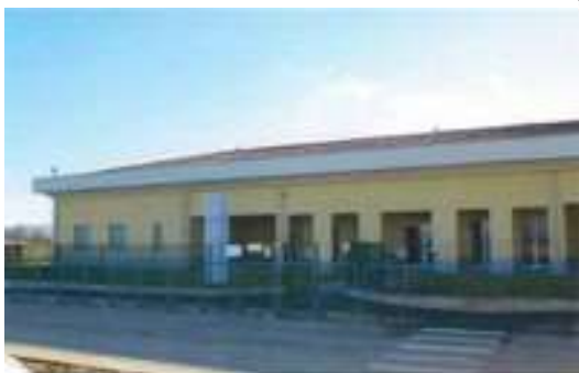
Scuola dell'infanzia, primaria ed RSA a Pinarolo Po